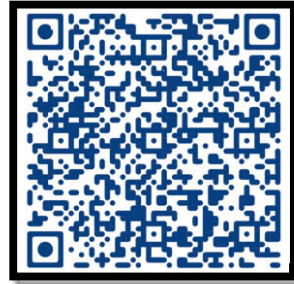
Nhu cầu người tìm việc