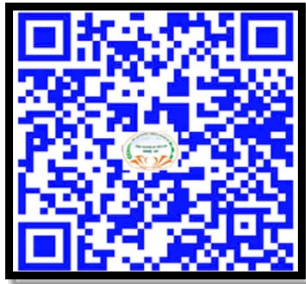
Nhu cầu nhà tuyển dụng